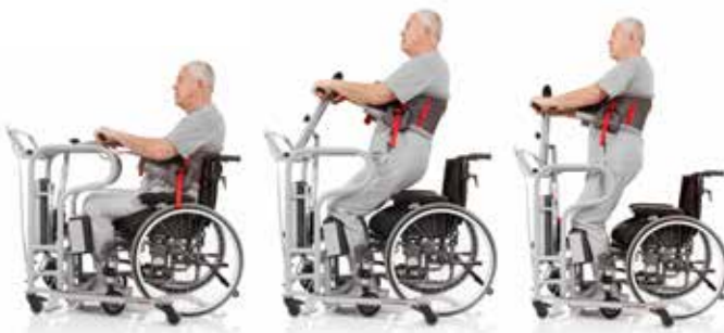
Bipedestación activa con patrón de movimiento natural

MiniLift125 ha sido desarrollada para, de la forma más cómoda y suave posible, ayudar al usuario al levantarse de estar sentado a una posición de pie. Las asas y los soportes laterales ofrecen múltiples opciones de colocación de manos para el usuario. La placa de pie estable antideslizante es muy baja y los soportes de la parte baja de las piernas, así como el brazo de grúa, se pueden ajustar para adaptarse a cada usuario de manera óptima. Cuando MiniLift125 se combina con los accesorios de elevación adecuados, el usuario recibe el apoyo bajo los pies, por la parte delantera de las piernas y detrás de la espalda, lo que proporciona un procedimiento seguro así como una bipedestación activa. La construcción mueve al usuario hacia delante y hacia arriba de forma segura en un patrón de movimiento natural y, al mismo tiempo, se ejercitan los músculos de las piernas y el equilibrio. MiniLift125 está fabricada en acero para la estabilidad y la fuerza y es adecuada para los usuarios con un peso de hasta 125 kg.